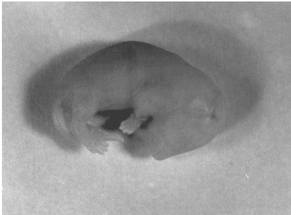
شکل ۲- بروز کیفوز و عدم تشکیل اندام فوقانی سمت راست در جنین دریافت کننده لاموتریژین با دوز 70 \text{ mg/kg}